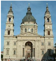
Bazilika sv. Štefana

Szent István Bazilika - je najväčším rímskokatolíckym chrámom v Budapešti. Nachádza sa v peštianskej časti Lipótváros a jej obrovskú monumentálnu kupolu vidieť z veľkej diaľky. Je vysoká 96 metrov, čo má aj svoj historický význam. Pripomína milénium príchodu maďarských kmeňov do Podunajska v roku 896. Chrám bol postavený v rokoch 1851 až 1905. Do chrámu sa zmestí až 8500 návštevníkov.