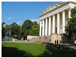
Maďarské národné múzeum

Neoklasicistická stavba s korintskými stĺpmi, ktorá sa nachádza na tzv. Malom bulváre. V budove sa nachádzajú kráľovské korunovačné klenoty a iné exponáty, ktoré sa týkajú histórie Karpatskej kotliny. Mnohé pamiatky pochádzajú z územia dnešného Slovenska.