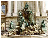
Socha Mateja Korvína na hradnom nádvorí

Budín aj Pešť rozkvitali najmä za vlády Žigmunda Luxemburského (zriadenie univerzity 1395) a Mateja Korvína (prvá kníhtlačiareň 1473). Prevažne na budínskom hrade sídlili aj v rokoch 1490 až 1526 českí králi Vladislav a Ľudovít. Za vlády Jagelovcov malo budapeštianske trojmestie okolo 25 - 30 000 obyvateľov a patrilo spolu s Prahou, Viedňou a Krakovom k najväčším sídlam strednej Európy. Mesto bolo dôležitým strediskom obchodu s dobytkom a vínom.