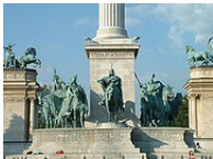
Námestie hrdinov, detail

Je to obrovské námestie, ktoré je známe najmä Pamätníkom milénia. Tento pomník pripomína milénium príchodu Maďarov do Karpatskej kotliny. Jadrom pamätníka je 36 metrov vysoký stĺp, na vrchole ktorého stojí postava archanjela Gabriela, ktorý sa podľa legendy v sne zjavil uhorskému kráľovi Štefanovi a ponúkol mu kráľovskú korunu. Vedľa piedestálu sedí na koni vojvodca Arpád a sedem kmeňových náčelníkov, ktorí priviedli staré maďarské kmene do novej vlasti. V polkruhovej kolonáde sa nachádzajú významné postavy maďarskej histórie na čele s uhorským kráľom Štefanom. Námestie sa stalo miestom, kde sa stretávajú maďarskí nacionalisti.