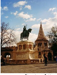
Pomník kráľa Štefana pred Rybárskou baštou

Jedna z najznámejších pamätihodností Budína. Je postavená na hradných hradbách. Pomenovaná je podľa rybárov (maď. halász znamená 'rybár'), ktorí v 18. storočí bašty bránili. V podstate však ide o neohistorickú stavbu z obdobia milierárnych osláv (neogotika, 1905). Napriek tomu patrí k najrušnejším miestam v Budíne s nádherným výhľadom na Dunaj a peštiansku časť mesta (hl. budovy Parlamentu). Neďaleko sa nachádza aj jazdecká socha zakladateľa Uhorského kráľovstva - sv. Štefana. Bašta a jej okolie dýchajú umeleckým duchom (pouliční hudobníci, maliari, ...). Pri pohľade na západ môžeme zbadáť zrkadlovú fasádu známeho budapeštianskeho hotela Hilton, ktorý vznikol prebudovaním staršieho sakrálneho objektu. Stavba je perfektným prepojením stredovekej architektúry s moderným umením.